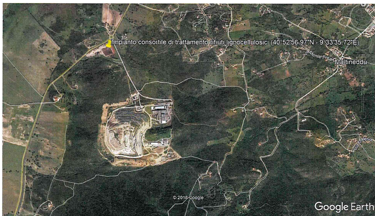
Figura 1: Ubicazione impianto (Fonte Google Earth)

L'impianto in questione è ubicato in Loc Spiritu Santu nel Comune di Olbia, come individuabile dal seguente stralcio dell'immagine satellitare (fonte: Google Earth):